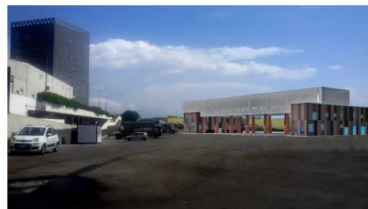
Nuova palazzina di Varco - Fotoinserimento