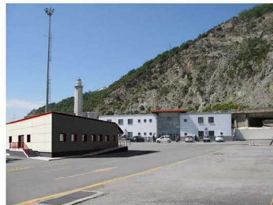
Nuovo edificio veterinari - Fotoinserimento