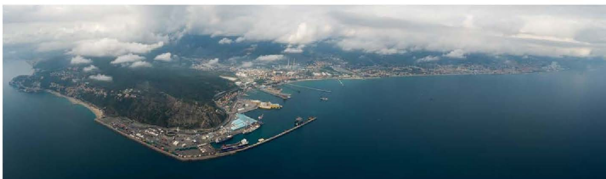
Il porto di Savona Vado

Nell'area di Capo Vado e più specificamente in "zona Faro", è ubicato un edificio a due piani attuale sede del Posto d'Ispezione Frontaliero per il controllo dei prodotti idonei al consumo sia umano (HC) sia non umano (NHC) e dell'Agazia delle Dogane. In particolare il progetto ha ritenuto di dover applicare il principio igienico sanitario secondo cui non vi deve essere commistione tra le zone "pulite" e quelle "sporche" e l'accesso e l'uscita dalle aree carico/scarico avviene solo tramite zone filtro.