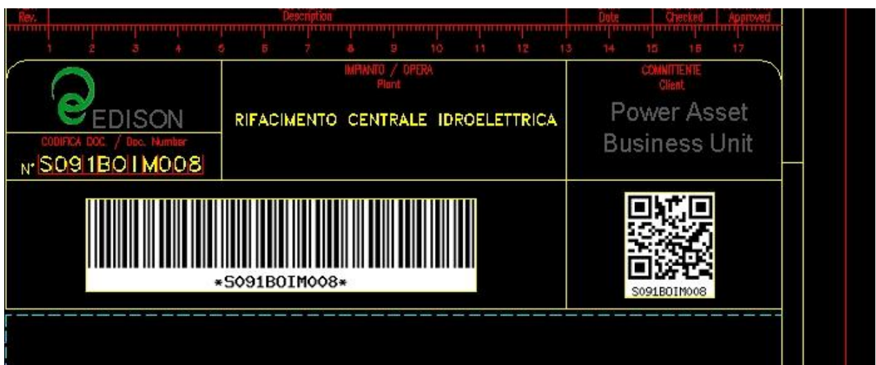
Codice a barre e QR code inseriti in un disegno Autocad

Lo strumento di lettura dei Codici a Barre può anche essere utilizzato per estrarre informazioni dall'archivio in maniera automatica. Sono state realizzate delle applicazioni in Excel che permettono di automatizzare e completare le liste dei documenti di ingresso in cantiere. I Codici a Barre stampati sui Disegni possono essere letti con l'apposito lettore, e scaricati su un file Excel che si connette ad ADT tramite gli strumenti Office di VBA e recupera via httpxml tutte le informazioni necessarie dall'archivio, compilando in automatico una lista completa dei Disegni